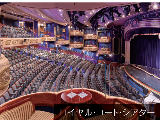
ロイヤル・コート・シアター