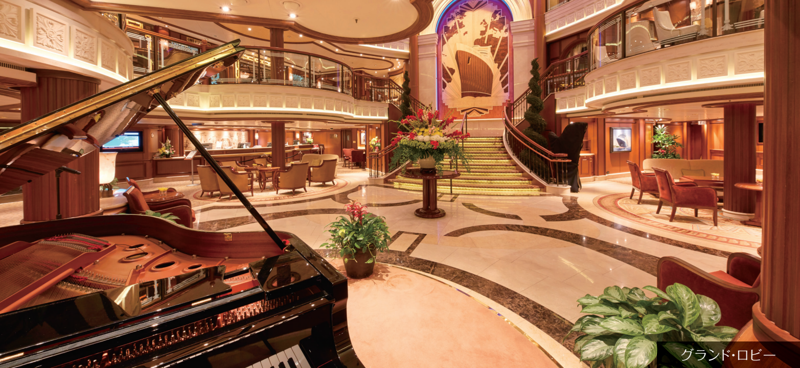
グランド・ロビー