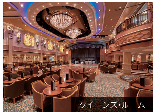
クイーンズ・ルーム