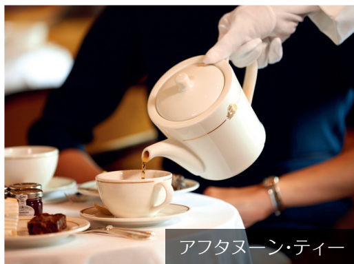
アフタヌーン・ティー